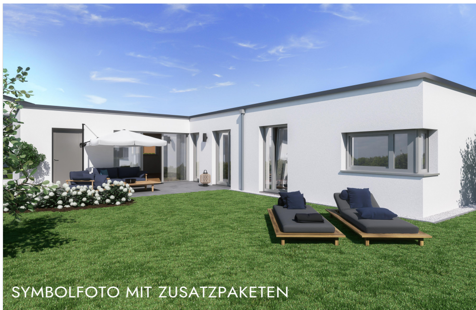
SYMBOLFOTO MIT ZUSATZPAKETEN